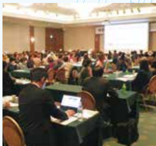
環境衛生担当者研修