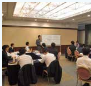
フォローアップ研修