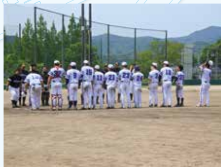
グループ野球大会