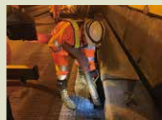
集水ます清掃作業