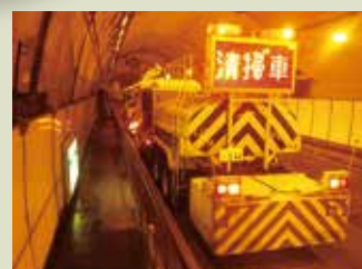
トンネル清掃作業

道路を健全に保つため路面や水路及び標識等を清掃し、お客さまへ快適な道路空間を提供します。