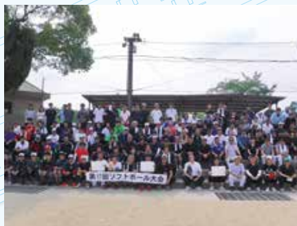
ソフトボール大会