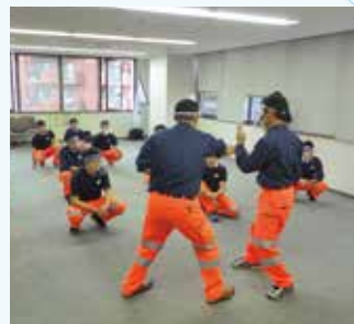
警備業 新任教育研修