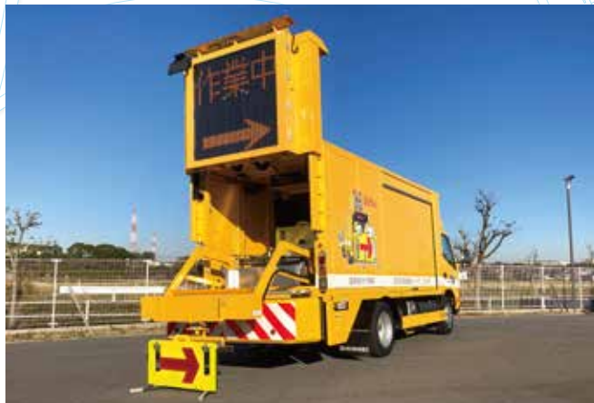
矢印板自動設置回収装置搭載型標識車 ロボアロー

全自動でラバーコーンの設置・回収ができ、作業員が荷台に乗車する必要がなくなります。さらに標識台が昇降するので、標識の取出し・格納が容易にできます。作業の安全性が格段に向上するとともに、作業時の負担は大幅に軽減されます。