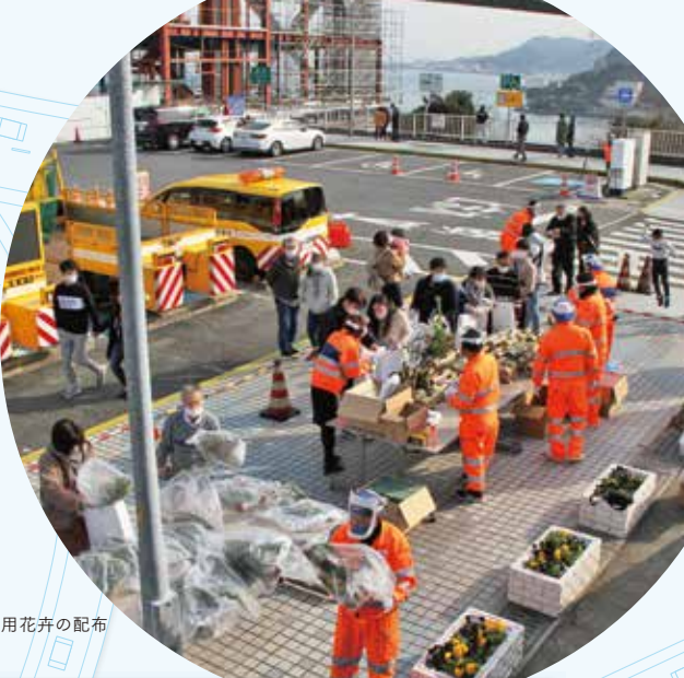
正月用花卉の配布

会社の持つ清掃・植栽の技能・機械力を生かし、公共施設や福祉施設の草刈り・剪定作業、高速道路沿線の清掃を行っています。また、地域行事や災害時のボランティア活動などにも積極的に参加しています。