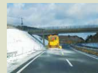
凍結防止剤散布作業