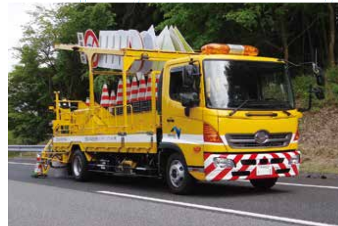
標識搭載型ラバーコーン自動設置回収車 ロボコーン

高速道路の維持・管理を通じて開発した商品や材料の販売、新技術・新工法の開発に積極的に取り組みます。