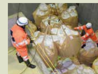
凍結防止剤荷下ろし