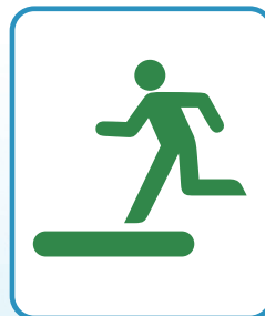
緊急避難場所マーク